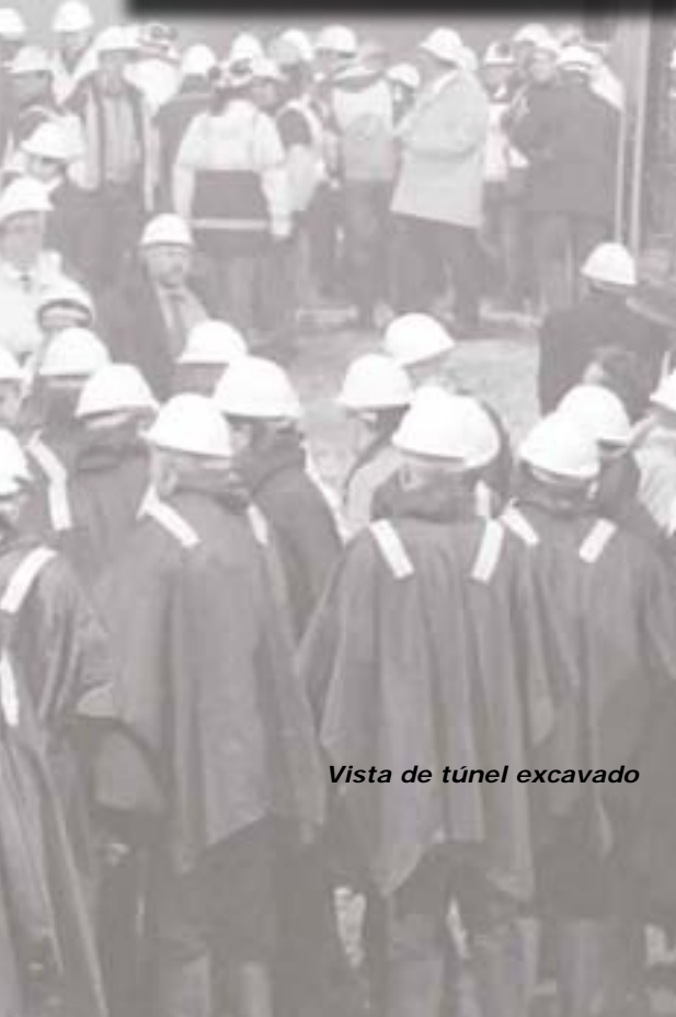
Vista de túnel excavado