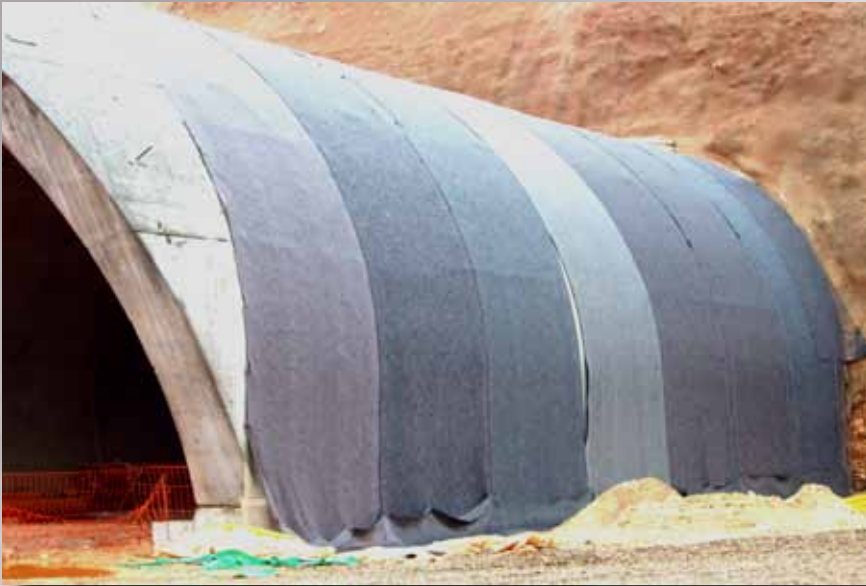
Sistema sandwich de PVC en impermeabilización de túnel artificial