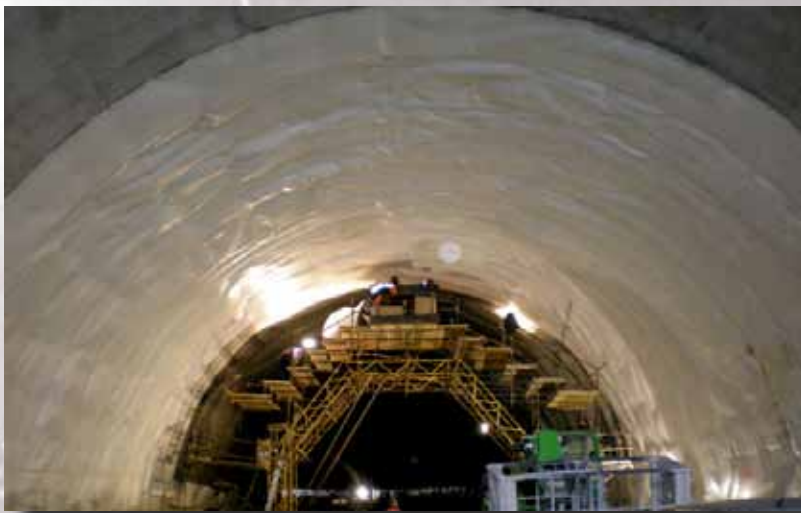
Operarios instalando lamina vista

ESPECIAL CUIDADO SE DEBE TENER EN INFRAESTRUCTURAS DONDE LOS GÁLIBOS SON MUY AJUSTADOS A LA CLASE DE VEHÍCULOS QUE CIRCULAN POR ELLAS.