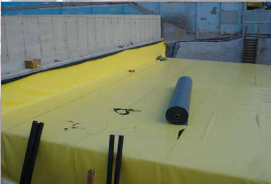
Tunel artificial en la línea amarilla del metro de Sao Paulo en Brasil

TODO ELLO SIENDO COMPAGINADO CON EL USO DE FIELTROS ANTIPUNZONANTES QUE EVITEN LA PERFORACIÓN DE LAS LÁMINAS IMPERMEABILIZANTES DURANTE LA FASE DE RELLENO.