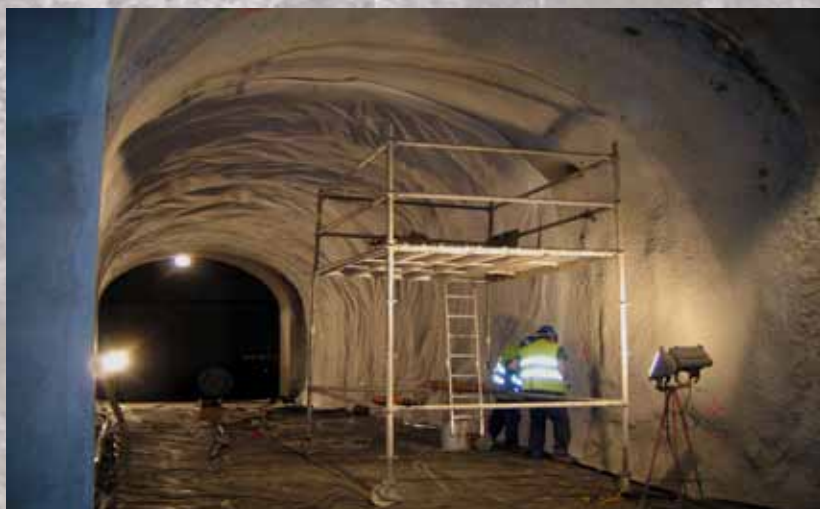
Instalación de lámina hidrofoba para posteriormente gunitarla