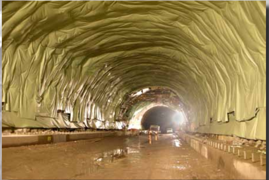
Vista de túnel durante los trabajos de impermeabilización con lámina de PVC