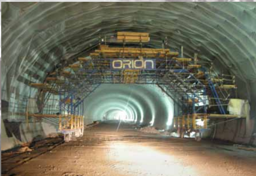
Impermeabilización de uno de los túneles de la variante sur metropolitana de Bilbao