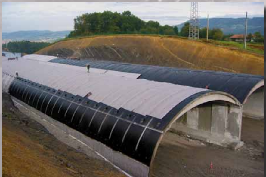
Tuneles artificiales en la autovía del Txorierri

LA EJECUCIÓN DE TÚNELES ARTIFICIALES DE HORMIGÓN ARMADO ES UNA DE LAS ESTRUCTURAS MÁS HABITUALES EN LAS GRANDES INFRAESTRUCTURAS VIARIAS EN LA ACTUALIDAD, Y SU IMPERMEABILIDAD REQUIERE DE UN BUEN DISEÑO Y MEJOR PUESTA EN OBRA.