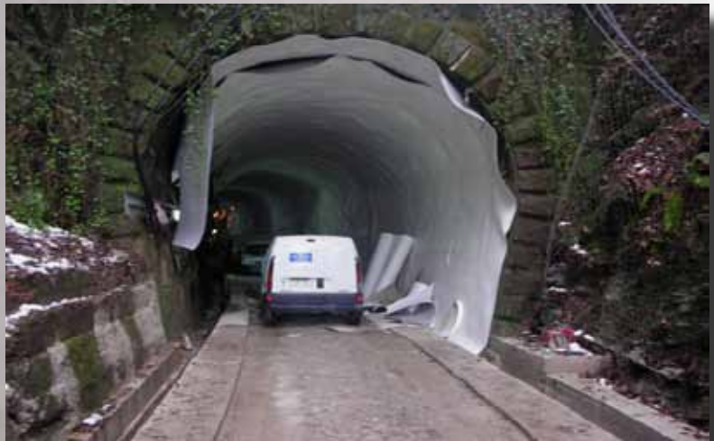
Antiguo túnel del ferrocarril reconvertido en vía ciclista en San Sebastian

EN MUCHOS TÚNELES SE HA DISEÑADO PARA LA IMPERMEABILIZACIÓN LA INSTALACIÓN DE LÁMINAS VISTAS DE POLIETILENO EXPANDIDO, YA SEA PORQUE SU ACABADO ES MEDIANTE HORMIGÓN PROYECTADO O PORQUE SON TÚNELES A REHABILITAR.