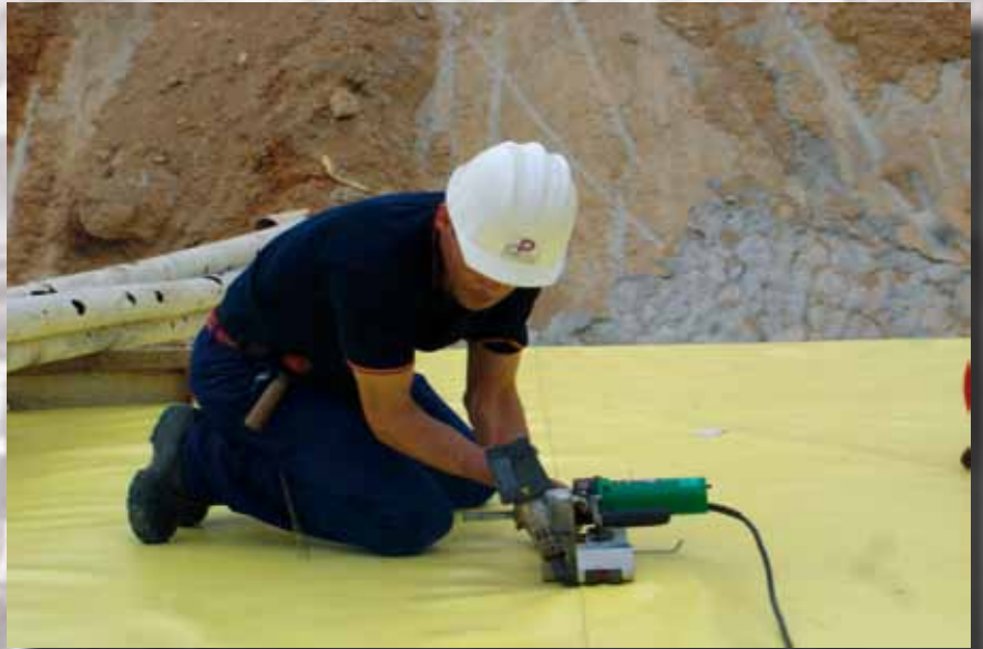
Operario soldando laminas