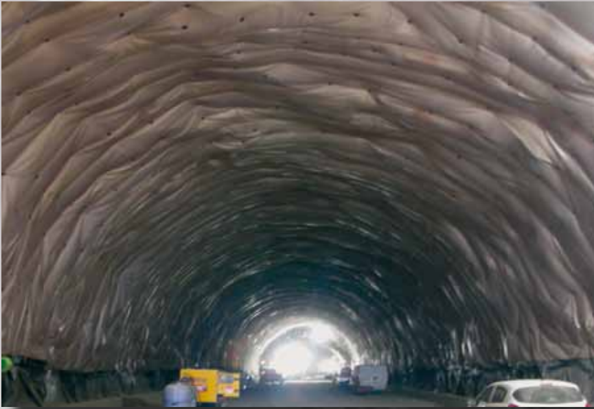
Impermeabilización del túnel de Monredos en Huesca