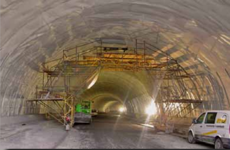
Vista de pórtico durante los trabajos de impermeabilización con lámina vista