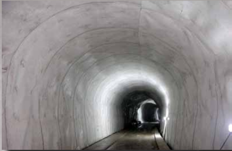
Galería de evacuación impermeabilizada con lámina vista