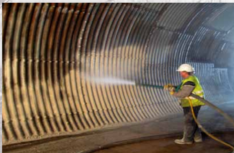
Proyección de membrana líquida sobre galería

DENTRO DE LAS NUEVAS TECNOLOGÍAS DESARROLLADAS PARA LA IMPERMEABILIZACIÓN DE TÚNELES, UNA DE LAS QUE MÁS ÉXITO HA TENIDO ES LA PROYECCIÓN DE MEMBRANAS IMPERMEABLES SOBRE LOS SOSTENIMIENTOS. UN SISTEMA MUY NOVEDOSO EN ESPAÑA, PERO QUE ALGUNOS PAÍSES DEL MUNDO COMO SUIZA, BRASIL, ETC., YA ESTÁN EMPLEANDO DE FORMA MÁS HABITUAL